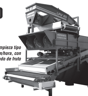
Conjunto de Limpieza tipo LPV 45 ton/hora, con destangado de fruto