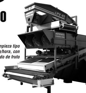
Conjunto de Limpieza tipo LPV 45 ton/hora, con desfangado de fruto