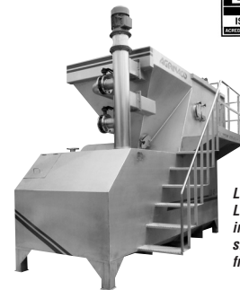
Lavadora de aceitunas LD 45 ton/hora, acero inox. con sistema aclarado de fruto en inox.

Tel./Fax: 953 630 116 • Móvil: 606 335 973 Barrio Colorado, 34 • 23220 Vilches (Jaén) agrinaco@terra.es • www.agrinaco.es