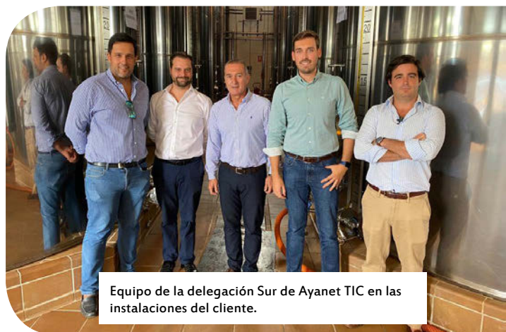
Equipo de la delegación Sur de Ayanet TIC en las instalaciones del cliente.

de aceituna de mesa. Basado en el ERP de Microsoft, Microsoft Dynamics NAV -también conocido como NAVISON-, siempre actualizado en las versiones de Dynamics y adaptado a la normativa del sector, NutriNAV ofrece la definición de las características y parámetros analíticos necesarios para tipificar las recepciones, con el fin de controlar la calidad del producto entregado. De implantación rápida y con precio conocido de licencias y servicios, NutriNAV permite llevar un control de las fincas origen de la aceituna, garantizando la trazabilidad posterior, y contemplando la gestión de fincas y tratamientos, el control de trabajos, consumos y gastos en campo, así como cuadernos de explotación -desde tablets y smartphones-. También proporciona control de costes al incluir una cuenta de explotación por finca y cultivo gracias a la utilización de una so-