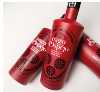
Ejemplos de trabajos de Serijerez para clientes del sector oleícola. De izqda. a dcha., y de arriba a abajo, botellas de Dominius Cosecha Temprana , Egregio , Knolive Epicure , La Maja , Hacienda Guzmán y Pago de Espejo .