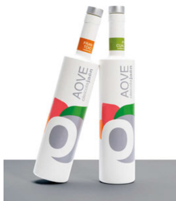
Botellas serigrafadas y pintadas para Oleícola Jaén.

Por otra parte, Serijerez es una empresa respetuosa con el medio ambiente que pone el foco en el uso de tintas orgánicas sin emisiones de solventes y un menor consumo energético.